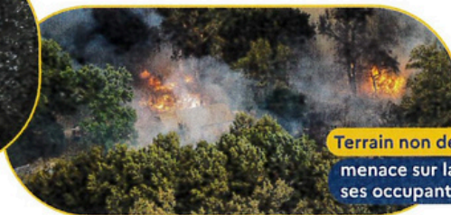
Terrain non débroussaillé menace sur la maison, ses occupants et la forêt