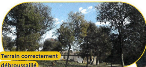
Terrain correctement débroussaillé maison et forêt protégées

Avec le changement climatique, les feux de forêt et de végétation sont de plus en plus forts et intenses. Le débroussaillage des abords de son habitation est le meilleur moyen de se protéger, de protéger ses biens et la nature environnante, face à ce danger.